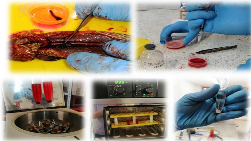
Figura 2. Obtención del riñón del animal y adición de Colchicina

La preparación de células mitóticas in vitro se realizó según la metodología de Foresti et al. (1993). Para esto, los peces fueron sacrificados, siguiendo el protocolo de Bienestar Animal y se retiró la parte anterior del riñón (Figura 2). Este material fue colocado en 6ml de medio de cultivo RPMI 1640 y disociado con la ayuda de una jeringa de vidrio sin aguja. A este medio de cultivo, se adicionaron tres gotas de colchicina (0.05%) con jeringa de 5 ml y se incubó a 37 °C durante 1 hora y 30 minutos. Pasado este tiempo, el material se resuspendió utilizando una pipeta Pasteur y centrifugado a 1000 r.p.m durante 10min, posteriormente el sobrenadante ser descartó. Se adicionó 7 ml de solución hipotónica (KCl) a 0.075M y se incubó a 37°C durante 52 min. Terminada la incubación se le adicionó 1ml de solución fijadora (metanol-ácido acético 3:1), se esperó 5min en los cuales se resuspendió la solución y luego se centrifugó a 1000 r.p.m durante 10 min. Se retiró el sobrenadante y añadió 6 ml de fijador, luego de mezclar bien con la pipeta Pasteur, se centrifugó durante 10min a 1.000 r.p.m. (Prefijación). Posteriormente, se descartó el sobrenadante y adicionaron 6ml de fijador y se centrifugó. Se repitió este paso 2 veces. Después de la última centrifugación y eliminación del sobrenadante, se adicionó 1ml de fijador y se resuspendió el material y se colocó en un tubo de 2ml.